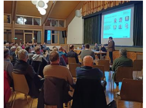
Vorstand und Kassenprüfer wurden bei der Mitgliederversammlung im November 2023 wiedergewählt.