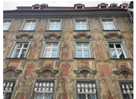
Das Projekt „Kick-Off Museumspädagogik“ ist dem EZ II - Schärfung des Tourismusprofils und Qualitätssteigerung der Angebote – zugeordnet.

Das mit der Regionalentwicklung Oberallgäu durchgeführte Kooperationsprojekt „ Weißtannenregion vom Allgäu bis zum Bodensee “ ist mit der Abwicklung des letzten Zahlungsantrags offiziell abgeschlossen. Dafür wurden von unserer LAG 36.959,00 Euro der 55.849,11 Euro umfassenden Fördersumme übernommen. Ziel des Projektes war es, Einheimische, Besucher und Waldbesitzer für die Notwendigkeit eines nachhaltigen, klimastabilen Waldumbaus und die Bedeutung der Weißtanne als wichtige stabilisierende Baumart zu sensibilisieren. Dafür wurden an acht Standorten wiedererkennbare Informationsstelen aufgestellt. Am Standort Weitnau-Missen ist zudem ein begehbare Holzturnm aus Weißtannenholz entstanden. Eine Vorstellung der einzelnen Stationen finden Sie hier auf unserem Instagram-Kanal.